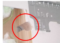
エアコンスリーブ穴開け時に柱を損傷した事例です。被害が大きい場合耐震性にも影響がでます。当社ならこうしたトラブルも防げます

東栄住宅の子会社であるため、お住まいの構造を熟知 品質を落とさないスリーブ穴開け工事が行えます